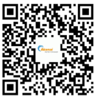
扫码关注，获取最新 CDN 前沿资讯

Akamai 为全球的大型企业提供安全的数字化体验。Akamai 的智能边缘平台涵盖了从企业到云端的一切，从而确保客户及其公司获得快速、智能且安全的体验。全球优秀品牌依靠 Akamai 敏捷的解决方案扩展其多云架构的功能，从而实现竞争优势。Akamai 使策略、应用程序和体验更贴近用户，帮助用户远离攻击和威胁。Akamai 一系列的边缘安全、Web 和移动性能、企业访问和视频交付解决方案均由优质客户服务、分析和全天候监控提供支持。如需了解全球顶级品牌信赖 Akamai 的原因，请访问 www.akamai.com 或 blogs.akamai.com ，或者扫描下方二维码，关注我们的微信公众号。您可访问 www.akamai.com/locations 查找全球联系信息。发布时间：2019 年 12 月。